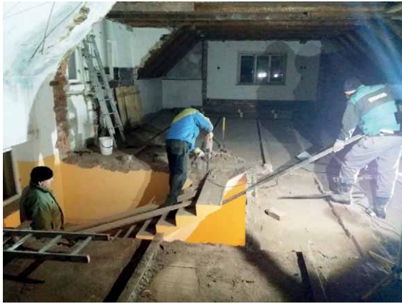
Foto z přestavby OÚ