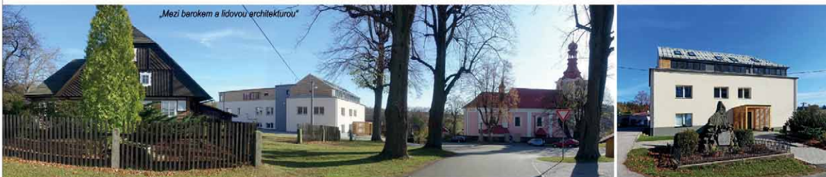
Místo stavby, urbanistické souvislosti a prostředí : Základní škola se nachází v centru obce Dobřany, přímo na její návsi, obklopena historickými objekty - kostel, fara, lidové chalupy, stodky. Prostedí má charakter malebné pohorské vesničky.